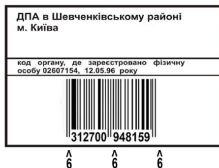
Звичайні комп’ютерні шістки, вони і є числом звіра

На такі пластикові паспорти перейшло 14 країн Шенгенського договору і тепер їх швидко хочуть розповсюдити на решту країн, як і на Україну, в яких буде зберігатися повністю інформація про людину і через які будуть порушуватися її права і воля. В нас на Україні масони запровадили закордонні пластикові паспорти і будуть діяти далі.